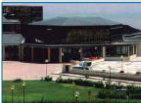
una veduta delle Terme