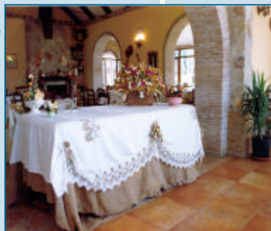
una veduta interna della struttura