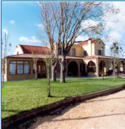
L'azienda agrituristica "Tenuta Capaccio", una piacevole realtà del Subappennino

tutto, insieme al rispetto della cultura e delle tradizioni popolari.